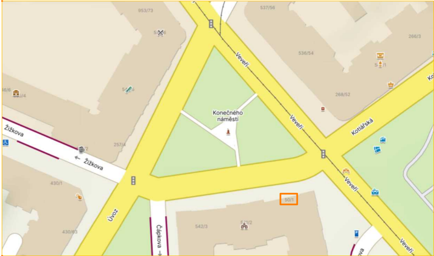
POLOHA STAVEBNÍHO ZÁMĚRU